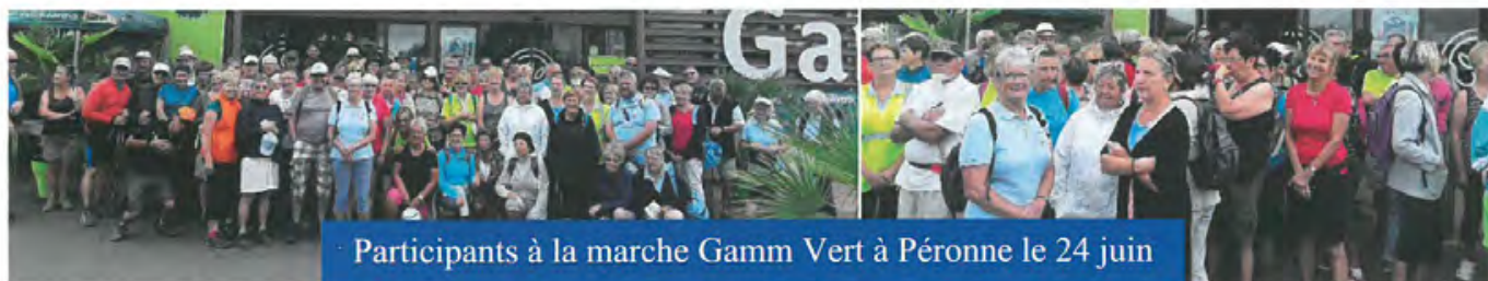
Participants à la marche Gamm Vert à Péronne le 24 juin

Le samedi 24 juin, et pour la seconde fois, le club organisait avec le magasin Gamm Vert de Péronne deux marches découvertes de la ville. Des marcheurs Péronnais s'étaient joints à nous pour une véritable fête. En effet le magasin avait fait les choses en grand : Au départ, café, gâteaux et fruits et au retour 4 énormes jambons cuits toute la matinée à la braise n'attendaient qu'à être dégustés. Chacun recevait un petit cadeau et un bon de réduction sur tout le magasin. Rendez-vous est pris pour l'an prochain.