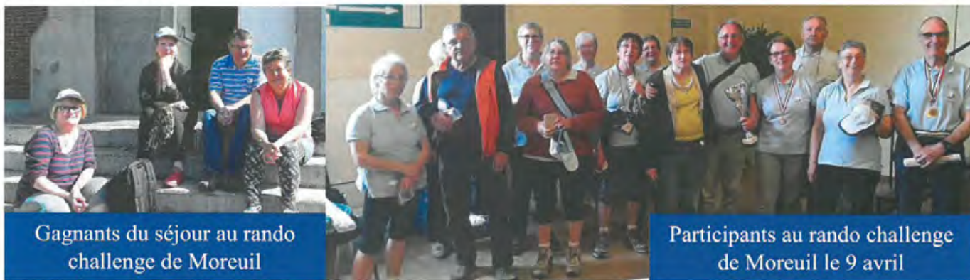
Gagnants du séjour au rando challenge de Moreuil

participants très motivés, mais, cerise sur le gâteau, notre équipe gagnante (il y a 2 ans) s'adjugeait la seconde place. Quel honneur !