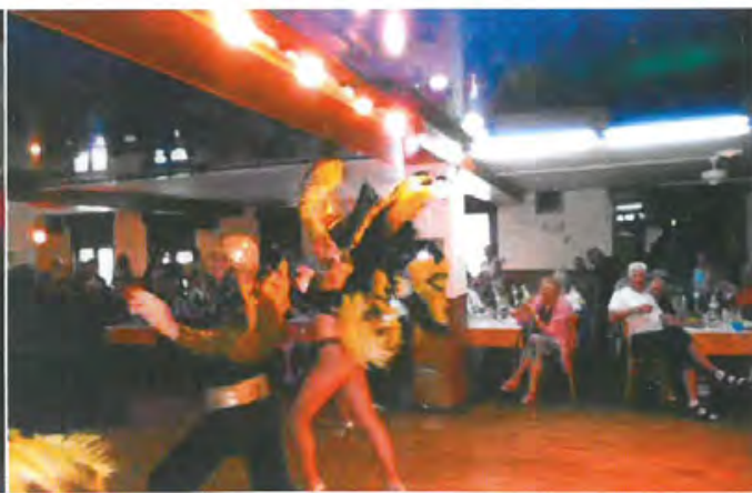
Spectacle « Folies Show »