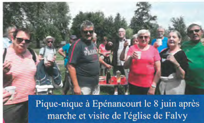
Pique-nique à Epénancourt le 8 juin après marche et visite de l'église de Falvy

Le samedi 24 juin, et pour la seconde fois, le club organisait avec le magasin Gamm Vert de Péronne deux marches découvertes de la ville. Des marcheurs Péronnais s'étaient joints à nous pour une véritable fête. En effet le magasin avait fait les choses en grand : Au départ, café, gâteaux et fruits et au retour 4 énormes jambons cuits toute la matinée à la braise n'attendaient qu'à être dégustés. Chacun recevait un petit cadeau et un bon de réduction sur tout le magasin. Rendez-vous est pris pour l'an prochain.