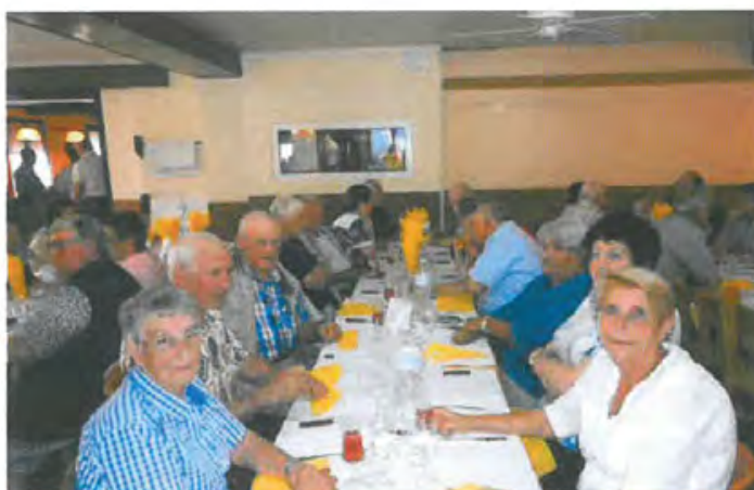
Une vue de la salle avec les Chaulnois

Ou à Serge LAMPERNESSE : 26 rue Odon Dumont 80320 Chaulnes (Tél : 06.14.82.22.58)