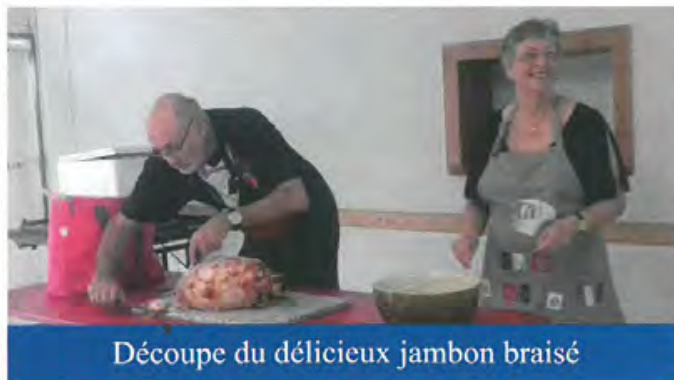
Découpe du délicieux jambon braisé