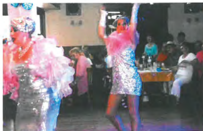
Une vue du spectacle « Folies Show »