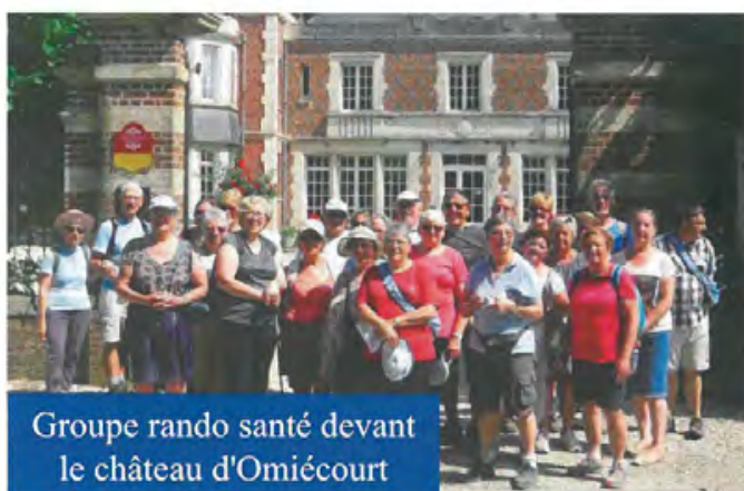
Groupe rando santé devant le château d'Omiécourt

La progression la plus importante du nombre de membres vient de la « Rando Santé » avec des sorties qui peuvent atteindre 45 marcheurs. Les raisons du succès : En premier lieu, l'ambiance, le besoin de se retrouver entre ami(e)s car dès la première participation vous devenez des ami(e)s ! Ensuite vient le choix des circuits. Nos animateurs ne cessent d'en découvrir de nouveaux dans des coins de notre région près de sites agréables et encore méconnus de certains. Enfin, c'est maintenant dans les esprits, le besoin de marcher pour la santé. Marcher, c'est vivre mieux.