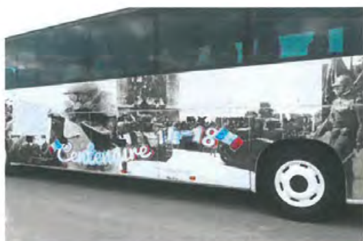
Le car du Centenaire de la Grande Guerre

Bonjour à toutes et à tous, amis Chaulnois.