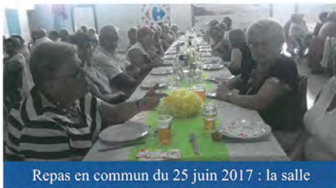
Repas en commun du 25 juin 2017 : la salle

Le semestre se terminait le lendemain, le 25 juin par le repas annuel du club. Dès 9h, une rando de 8kms au départ du CSC, suivie une ½ heure plus tard d'une rando santé de 5kms500. Le midi, après l'apéritif, 91 convives se retrouvaient à table pour un excellent repas préparé toute la matinée par nos marcheuses toujours très bénévoles. Le président s'amusait lui aussi à jouer au cuisinier en découpant deux magnifiques jambons livrés tout chauds, tandis que notre ami Paulo servait les portions de frites qu'il avait mis la matinée à préparer.