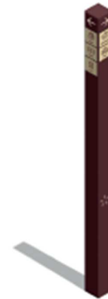
DP Signalisation directionnelle piétonne