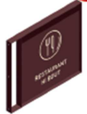
E Enseignes commerces