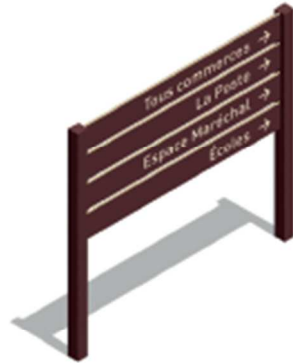
SIL Signalisation d'information locale