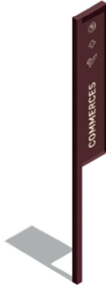
ZC Signalisation zones commerçantes