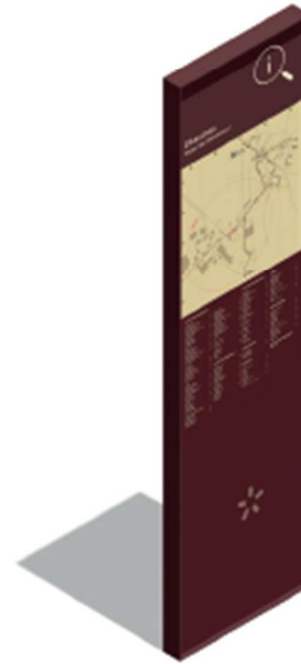
RIS Relai info services