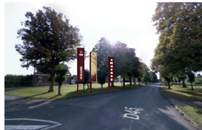
Exemple verso à Rosières-en-Santerre