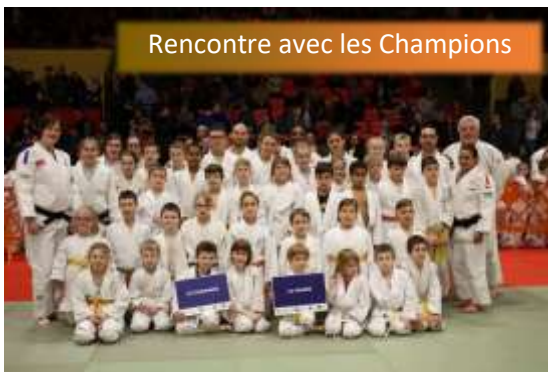
Rencontre avec les Champions

Des efforts qui d'ailleurs les ont amenés à rencontrer notre équipe de France lors d'un entraînement au Coliséum, ce mois de mars. Une journée riche en souvenirs pour nos jeunes judokas ! Le cours adultes du mardi soir compte de plus en plus de membres désireux de reprendre un sport qu'ils connaissent déjà ou simplement de découvrir notre philosophie et nous en sommes ravis.